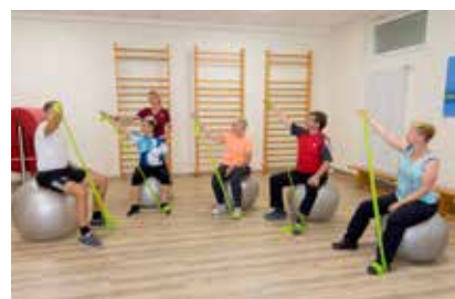
Übungen in der Gruppe sind motivierend!