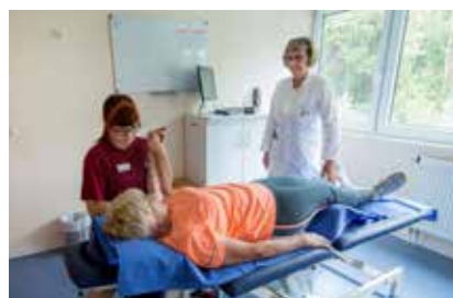
Die Therapie ist individuell auf Ihre Erkrankung abgestimmt

Bei der Bewältigung der körperlichen und seelischen Folgen Ihrer Erkrankung und der Suche nach Antworten auf Ihre Fragen sind Sie nicht allein. Wir stehen Ihnen mit unserem gesamten Team zur Seite.