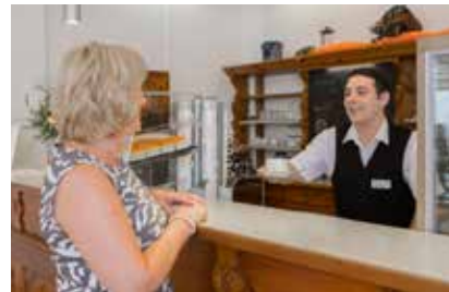
Wie wär's mit einem leckeren Cappuccino in unserem Café?

Unser hauseigenes Café „Schöne Aussicht“ bietet Ihnen am Nachmittag eine große Auswahl an frischen Torten und Kuchen, herzhaften Snacks, Süßigkeiten und ausgewählten Kaffeespezialitäten.