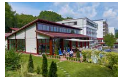
Außenansicht der Klinik

Während Ihres Krankenhausaufenthaltes kann über Ihren Klinikarzt oder den Sozialdienst eine Anschlussrehabilitation (AHB) beantragt werden. Auch bei einer ambulanten Bestrahlung oder Chemotherapie kann eine Anschlussrehabilitation (AHB) von Ihrem zuständigen behandelnden Arzt eingeleitet werden. Sie selbst haben die Möglichkeit, über das sogenannte Wunsch- und Wahlrecht, die Wahl Ihrer Klinik mitzubestimmen. Wenn erhebliche Funktionsstörungen vorliegen, kann im Einzelfall auch bis zum Ablauf von zwei Jahren nach der Erstbehandlung eine weitere Rehabilitation stattfinden. Den Antrag hierfür können Sie mit Unterstützung Ihres zuständigen behandelnden Arztes bei Ihrer Renten- oder Krankenversicherung stellen (Formulare erhalten Sie z.B. unter www.driv-bund.de ). Weitere Informationen erhalten Sie von den Servicestellen für Rehabilitation ( www.reha-servicestellen.de ) und Krebsberatungsstellen.