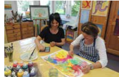
Hier ist Kreativität gefragt

Neben den speziell auf Sie abgestimmten Behandlungen sollten Sie auch einmal Ihre Seele baumeln lassen. Eine Vielzahl von Kreativkursen und Kulturangeboten bieten Abwechslung und Anregung. Unter Anleitung und in Eigenregie entstehen in unserer Kreativwerkstatt Ihre schönsten Werkstücke. Nehmen Sie teil an Wanderungen und Ausflugsfahrten und lernen Sie die reizvolle Spessartlandschaft mit ihren herrlichen Naturwäldern kennen. Erfreuen Sie sich am vielseitigen Veranstaltungsprogramm mit Konzerten, Theater und Kinoabenden im Spessart FORUM.