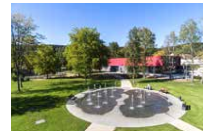
Der Kurpark lädt zum Verweilen ein

Bad Soden-Salmünster ist ein idealer Ausgangspunkt für viele unvergessliche Wanderungen, liegt der Ort doch direkt am Fuße der waldreichen Mittelgebirge Vogelsberg, Rhön und Spessart. Mit Gelnhausen und Steinau a. d. Str. in der Nachbarschaft erwarten Sie mittelalterliche Städte mit besonderem Flair. Auch die Nähe zur Barockstadt Fulda lädt zu einem Entdeckungsausflug in den berühmten Dom, die fürstlichen Gärten und die Orangerie ein. Die Großstadt Frankfurt am Main mit Zeil, Mainufer und vielen Sehenswürdigkeiten erreichen Sie ebenfalls innerhalb von 45 Minuten bequem mit der Bahn.