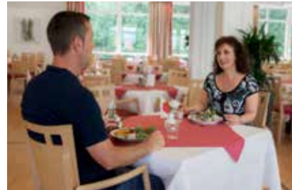
Ausgewogene und abwechslungsreiche Mahlzeiten erwarten Sie

Unsere Küche genießt einen sehr guten Ruf. Wir bieten Ihnen gesunde, ausgewogene sowie abwechslungsreiche Speisen, die täglich frisch von unserem hauseigenen Küchenteam zubereitet werden. Wählen Sie einfach Ihr Lieblingsgericht vom Buffet. Selbstverständlich werden auch spezielle Diät- und Sonderkostformen (u.a. allergenfreie Kost) angeboten. Unsere Ernährungsberatung steht Ihnen bei Fragen jederzeit zur Verfügung.