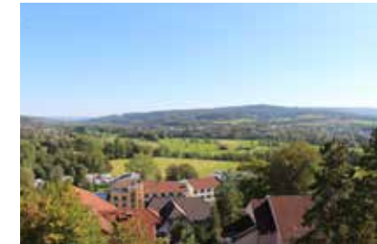
Herrlicher Blick über den Spessart - Natur pur!

Die Klinik Bellevue liegt direkt am Waldrand mit einem wunderschönen Blick über Bad Soden-Salmünster, das Kinzigtal und den Spessart. In nur wenigen Minuten erreichen Sie den Kurpark mit Generationenpark und Fontänengarten und die Spessart Therme mit Spessart FORUM. Direkt hinter der Klinik liegt der Sodener Stadtwald mit Wildpark, Walderlebnispfad sowie schönen Wander- und Spazier-Rundwegen.