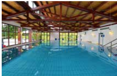
Unser Schwimmbad mit 32° Wohlfühltemperatur

Unser Haus verfügt über großzügige Aufenthaltsräume mit besonderem Flair. Plauschen Sie in unserem gemütlichen Café „Schöne Aussicht“ bei einer duftenden Tasse Cappuccino, verweilen Sie bei einem guten Buch in unserer Leseecke, amüsieren Sie sich bei unseren abwechslungsreichen Abendveranstaltungen oder lassen den Abend mit einer Partie Billiard ausklingen. Unser modernes Schwimmbad mit 32° Wohlfühltemperatur und harmonischer Farblichtgebung sowie die Sporthalle runden das Freizeitangebot ab.