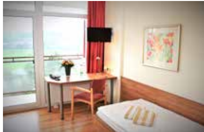
Wohnbeispiel eines Einzelzimmers

Falls Sie in Begleitung anreisen möchten, bieten wir Ihnen in begrenztem Umfang auch die Möglichkeit, eines unserer geräumigen Doppelzimmer zu reservieren.