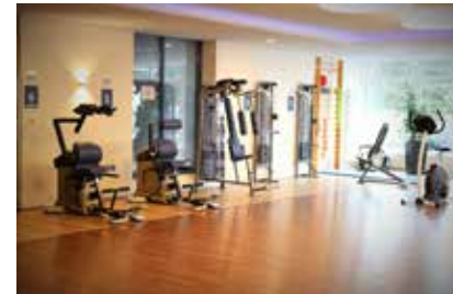
Unser modern eingerichteter Trainingsraum

Außerhalb der Therapiezeiten stehen Ihnen Fahrradergometer, unser Muskelaufbautrainingsraum und die Sporthalle zur freien Verfügung.